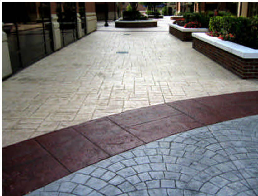
Thin-Set Bomanite Impreso.