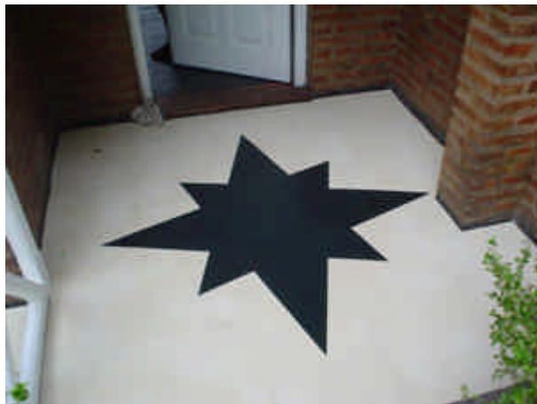
Thin-Set alisado con Diseño en MicroTop Bomanite.