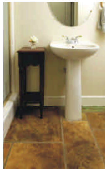
Thin-Set texturado con aplicación de Pátinas Bomanite.